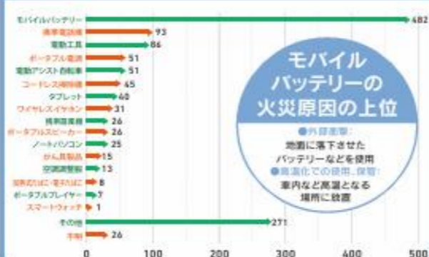
R7(1~12月) リチウムイオン電池等から出火した火災*の件数

廃棄されたリチウムイオン電池等を回収中の農作業及びごみ処理関連施設から出火した火災件数を除く。